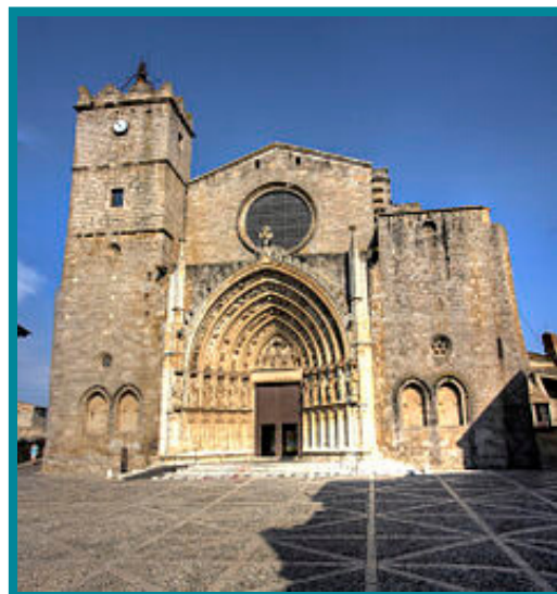
Fachada de la basílica de Santa Maria de Castelló d'Empúries, catedral del Empordà

Enlace (IFMuC): http://ifmuc.uab.cat/collection/CdE?ln=es