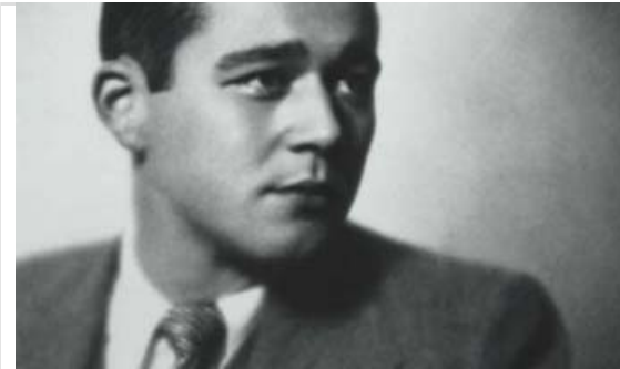
Jaume Vicens Vives en la imatge escollida per promocionar l'exposició que commemora el centenari del seu naixement